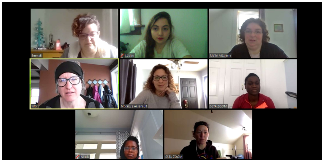
L'équipe de la SAF Île en rencontre avec les directions des Comités régionaux.

Le mois de Juin est consacré à l'organisation au format inédit de la fête nationale de l'Acadie, le 15 août 2020. La SAF Île et les six comités régionaux travaillent ensemble pour offrir une célébration adaptée au contexte.