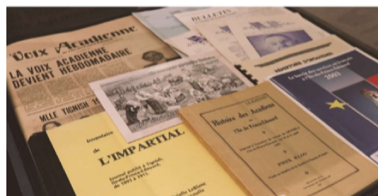
Vernissage de l'exposition au Musée Acadien

Que peut-on souhaiter pour l'avenir de la Société?