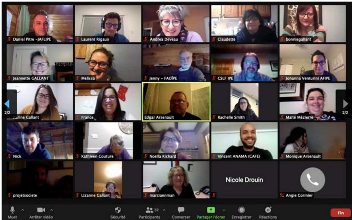
Réunion du réseau des développeurs