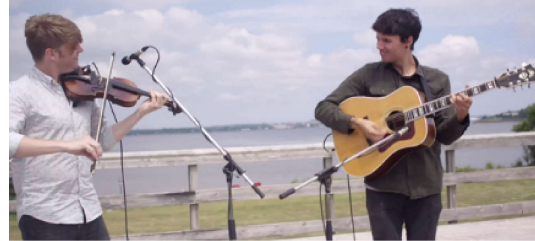
Extraits du film L'Acadie de l'Île : 300 ans d'histoire à découvrir.