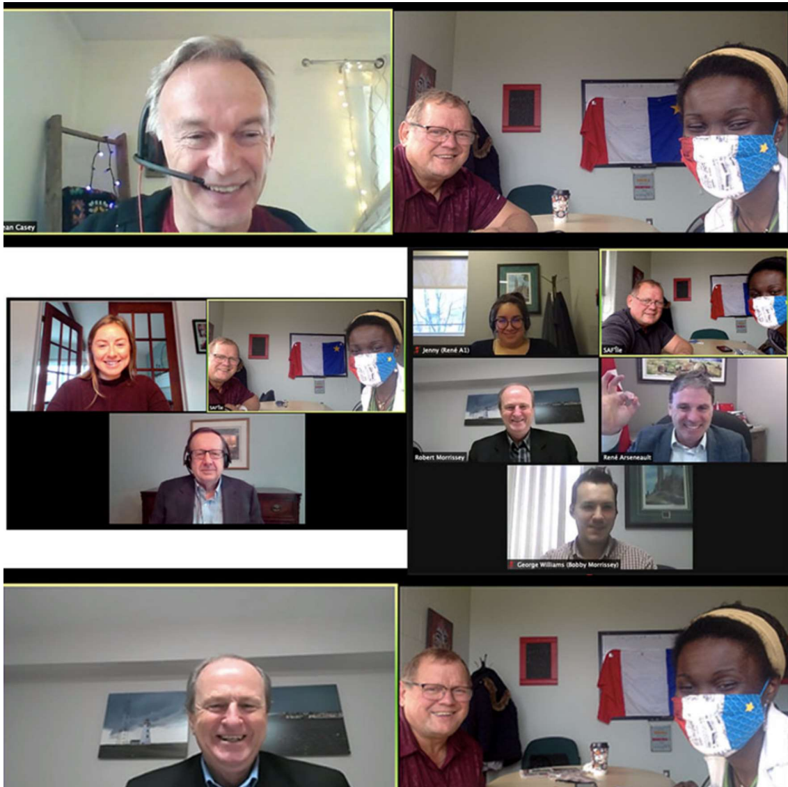
Rencontres sur la plateforme Zoom pour défendre le projet de modernisation de la loi sur les langues officielles.

La Société acadienne et francophone de l'Île-du-Prince-Édouard, le Musée acadien de l'Î.-P.-É et Parcs Canada en partenariat avec la Fédération culturelle de l'Î.-P.-É. organisent la 13ème cérémonie du Jour du Souvenir acadien le dimanche 13 décembre à Skmaq—Port-la-Joye—Fort-Amherst, haut lieu historique national. En raison de la pandémie et des récents développements, la cérémonie a été annulée en présentiel. Une commémoration adaptée s'est faite en ligne pour marquer la journée.