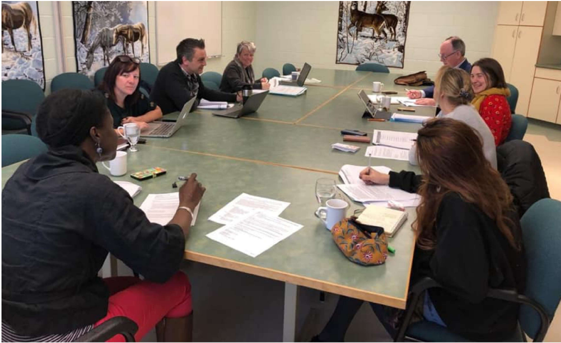
L'une des dernières rencontres en personne avec les membres du Comité de travail et de mise en œuvre (CTMO) en mars 2020

La dernière étape des démarches légales relatives au processus de changement de nom entamées fin 2019 est finalement complétée au début du mois de juin 2020 sur le stationnement.