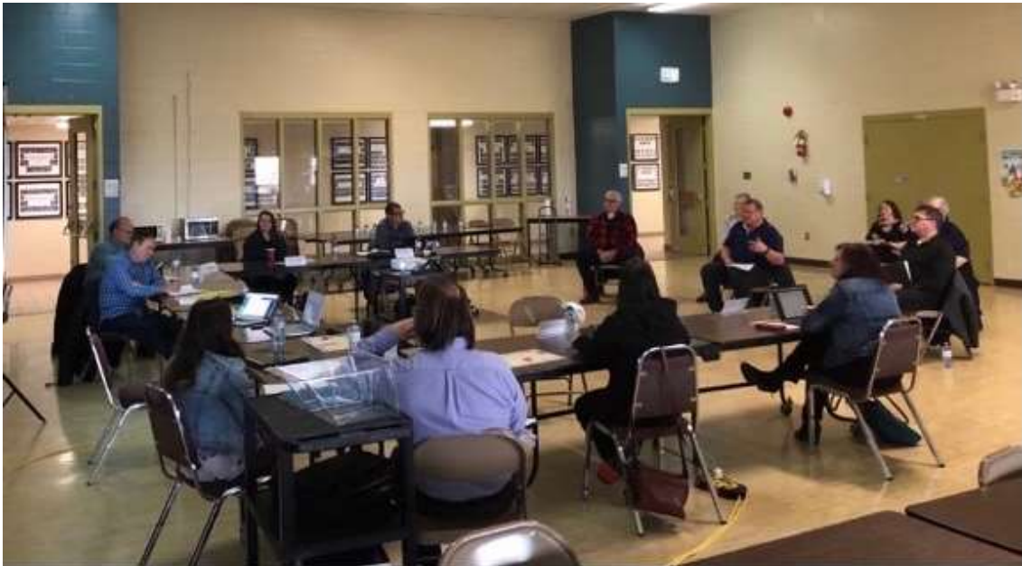
Rencontre des commissaires et dirigeants de la CSLF avec la direction et des membres du CA de la SAF'île – 13 avril 2021.

Les propositions faites à la CSLF se basent sur trois grands axes: