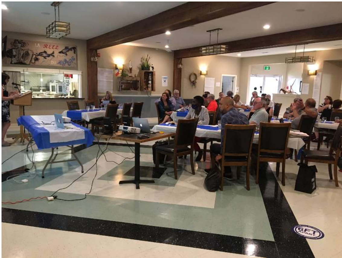
Rencontre du Réseau des développeurs – 29 juin 2021 au Village musical - Abram Village.

La prochaine étape pour lancer le service partagé en ressources humaines est le recrutement d'un.e spécialiste RH. À cet effet, une offre de poste a été diffusée. Le ou la gestionnaire sera responsable entre autres de planifier, élaborer, appliquer et évaluer les stratégies de ressources humaines : politiques, programmes de formation, procédures, rémunération, régimes d'avantages sociaux etc. Le détail de l'offre de poste publiée est disponible est consultable ici .